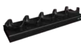
五插槽電池充電座