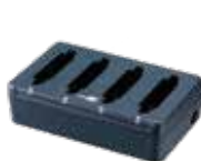
四插槽電池充電座